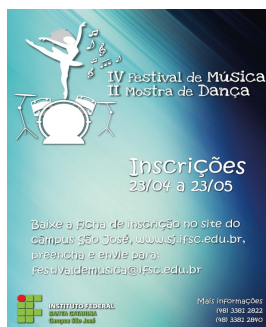
Figura 1 – Banner de divulgação do IV Festival de Música e II Mostra de Dança.

Trazer para a comunidade o IV Festival de música e II mostra de dança do IFSC – Câmpus São José, requer reunir uma equipe organizadora para pensar e desenvolver, nos mínimos detalhes, as várias ações que o evento possui. A comissão responsável pelo evento é composta por servidores administrativos, professores, e aluno extensionista, sendo este bolsista do projeto. Todas as atividades são discutidas e definidas em reuniões mensais. Após a divulgação do regulamento do evento, são organizadas atividades de divulgação em salas de aulas do Câmpus, textos publicados na página do IFSC, confecção de murais, confecção da logo, cartazes e banner, além da divulgação em redes sociais.