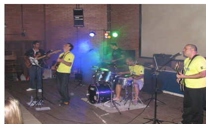
Figura 2 – Banda Gaciba e os Mitocôndrias no III Festival de Música e I Mostra de Dança.

com a participação de dez bandas musicais, além de bandas convidadas, como por exemplo a banda formada por professores do Câmpus: Gaciba e os Mitocôndrias. Essa banda foi formada para participar do I Festival, em 2010, e sempre esteve presente nas demais edições do Festival.